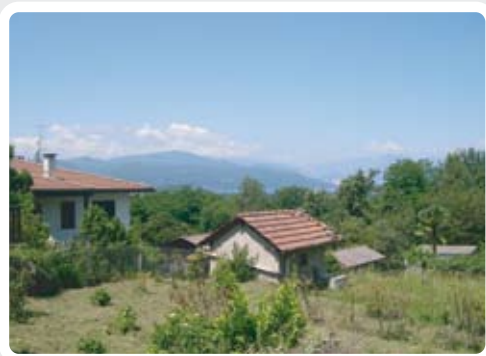
< Veduta panoramica di Monate.