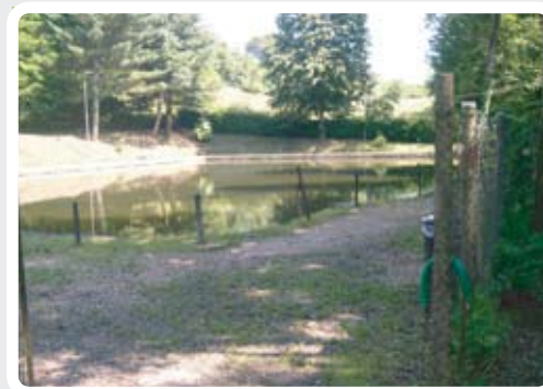
Laghetto dei Margin >