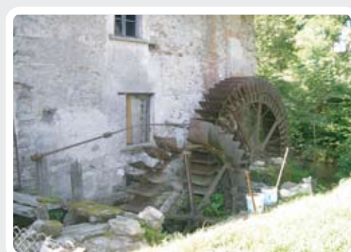
Particolare del Mulino di Turro >