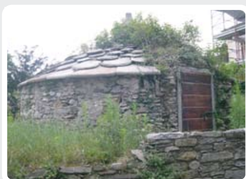
< Ghiacciaia a Bardello.