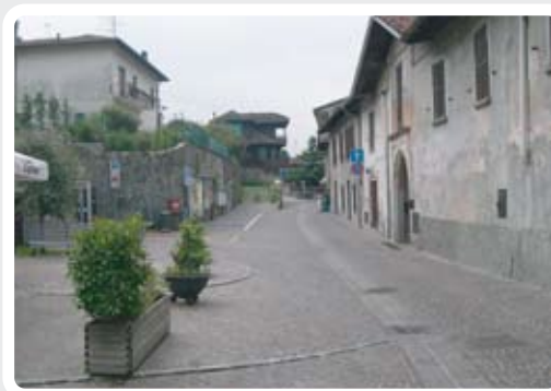
Il Centro Storico di Comabbio. >