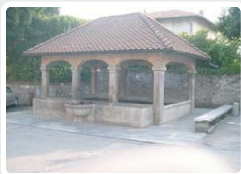
< Lavatoio di Osmate.

Nota: il profilo non considera la variante dell' Anello di Osmate