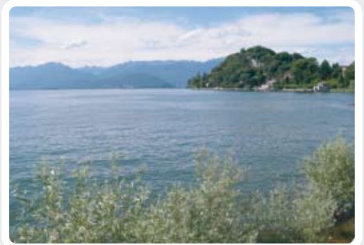
Vista panoramica dal Sasso Moro. >