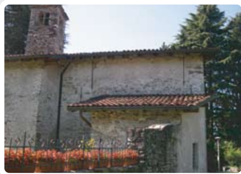
< la Chiesa di San Defendente.